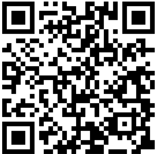
Grundbaustein finden (5)